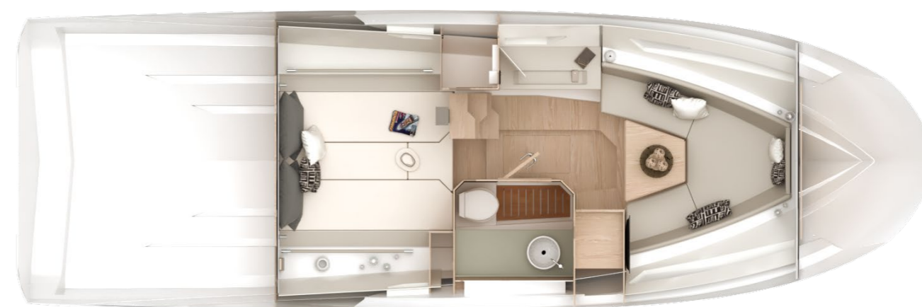
INBOARD LOWERDECK LAYOUT

The mix between the different colors and materials, together with the side windows on the hull, contributes to bright the area, that becomes even more livable during the day and the evening too.