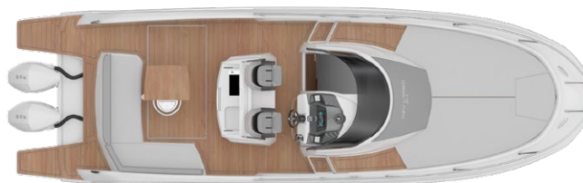
OUTBOARD MAINDECK LAYOUT WITH T-TOP