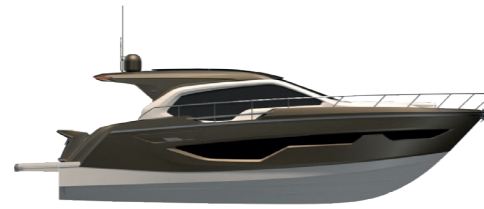
GOLD METALLIZED (paint)