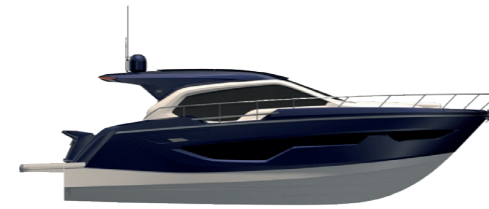
COSMIC BLUE METALLIZED (paint)