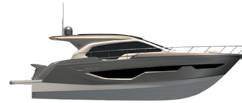
SILVER CASHMERE METALLIZED (paint)