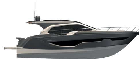
DARK GREY METALLIZED (paint)